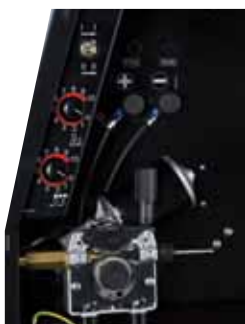
Sistema de alimentación profesional, fácil cambio de polaridad

Las Powertec® 191C y 231C tienen la potencia requerida para aplicaciones de soldadura ligera, permitiendo soldar también materiales de chapa fina aplicables a la Powertec 161C. La Powertec® 271C verdaderamente es un modelo multifunciones en esta gama, ideal para soldadura en chapa fina y para trabajos en construcción de ligera a media.